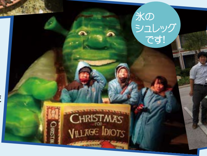
氷の シュレック です!

世界は広い! 何もかも大きいアメリカでした。 世界のアミューズメントが集まる IAAPAはもちろん!